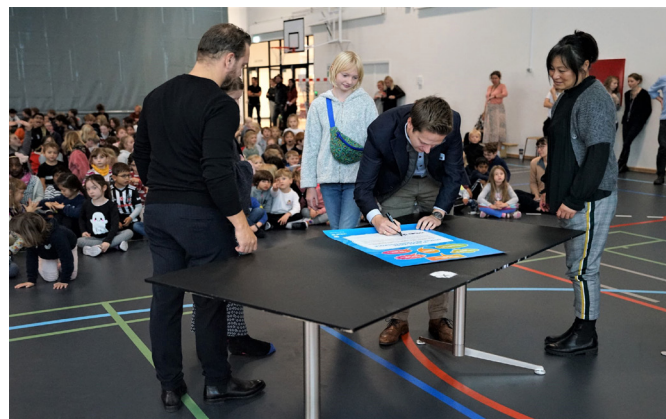
I oktober 2019 startede skolen en rejse mod at blive en Unicef rettighedsskole.

Fra sommeren 2020 åbner skolen også de første gymnasieklasser i engelsk og dansk sprogsektion. Sprog får en central plads i undervisningen. Al sprogundervisning er med modermåltalende lærere, og eleverne bliver undervist i fag som geografi og historie på deres første fremmedsprog, som kan være engelsk, fransk eller tysk.