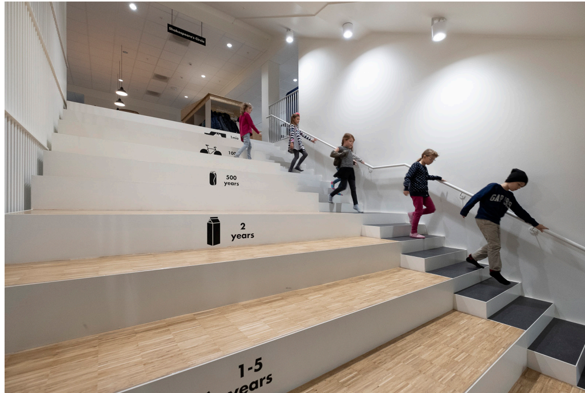
Københavns Kommune takker for bidragene, der har muliggjort dette byggeri.