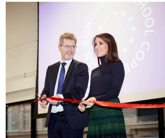
Båndet klippes af Københavns overborgmester Frank Jensen og H.K.H Prinsesse Marie.