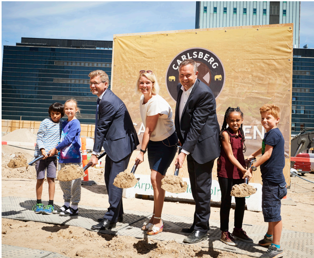
Første spadestik til den nye Europaskole blev taget i 2016. Europaskolen flyttede ind i bygningen i Carlsberg Byen i efteråret 2018.