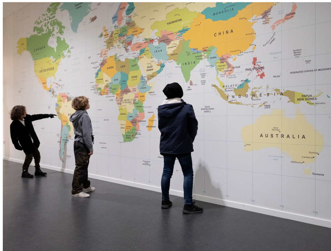
Målet for hele Europaskolen er at give elever en tværkulturel uddannelse, hvor de lærer at begå sig i en globaliseret verden.

Ved skolestart 20/21 åbner skolen tre nye børnehaveklasser (en i hver sprogsektion) og en ny secondary 1 klasse i fransk sprogsektion. Der er åbent for ansøgning for nye elever frem til 19. januar 2020.