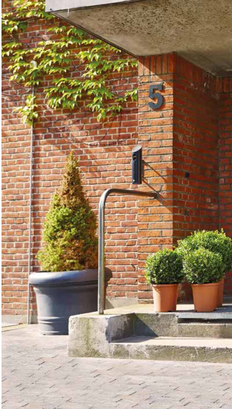
Udgivet august 2018. Grafisk design: prik.dk